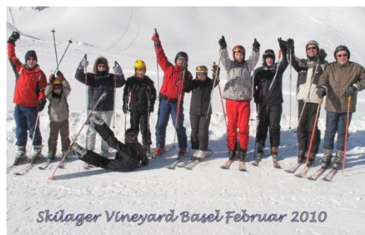
Skilager Vineyard Basel Februar 2010